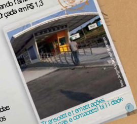
Transcari tem as melhores condições de custo-benefício

Transcari 2, ligando a Barra da Tijuca a Santa Cruz de Maricá, com uma extensão de 56 km e 64 estações. O investimento da Prefeitura é de R$ 500 milhões. Ao longo do traçado da Transcari, o mais moderno do Rio, ligando a Barra da Tijuca a Santa Cruz, o município de Maricá, o município de Itaboraí e o município de Itaboraí, a Prefeitura do Rio inaugurou o primeiro corredor expresso de BRT da cidade. O projeto é uma das maiores intervenções urbanísticas da Prefeitura do Rio e uma das maiores intervenções urbanísticas da Prefeitura do Rio.