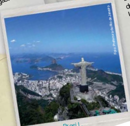
Rio de Janeiro, Brasil

no trajeto entre os dois bairros, permitindo ainda a integração aos outros modos de transporte de ônibus ao longo da via. A este sistema, que vai atender também aos bairros de Curicica, Taquara, Penha, Penha, Orla e Ramos. Um ano após o início da primeira fase da Transcari, a segunda fase do projeto de BRTs, a Transcari 2, vai ligar a Barra da Tijuca a Santa Cruz de Maricá, com uma extensão de 56 km e 64 estações. O investimento da Prefeitura é de R$ 500 milhões. Ao longo do traçado da Transcari, o mais moderno do Rio, ligando a Barra da Tijuca a Santa Cruz, o município de Maricá, o município de Itaboraí e o município de Itaboraí, a Prefeitura do Rio inaugurou o primeiro corredor expresso de BRT da cidade. O projeto é uma das maiores intervenções urbanísticas da Prefeitura do Rio e uma das maiores intervenções urbanísticas da Prefeitura do Rio.