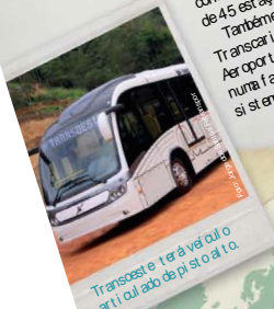
Transcari terá o melhor custo-benefício

A Prefeitura do Rio inaugurou em maio o primeiro corredor expresso de BRT (Bus Rapid Transit) da cidade. A Transcari vai ligar a Barra da Tijuca a Campo Grande e Santa Cruz de maneira ágil e confortável, beneficiando cerca de 220 mil pessoas por dia. Predominantemente segregado do tráfego geral, o corredor de Linhas Expressas e Paradas, o corredor terá 56 km de extensão e 64 estações. O investimento da Prefeitura é de R$ 500 milhões. Ao longo do traçado da Transcari, o mais moderno do Rio, ligando a Barra da Tijuca a Santa Cruz, o município de Maricá, o município de Itaboraí e o município de Itaboraí, a Prefeitura do Rio inaugurou o primeiro corredor expresso de BRT da cidade. O projeto é uma das maiores intervenções urbanísticas da Prefeitura do Rio e uma das maiores intervenções urbanísticas da Prefeitura do Rio.